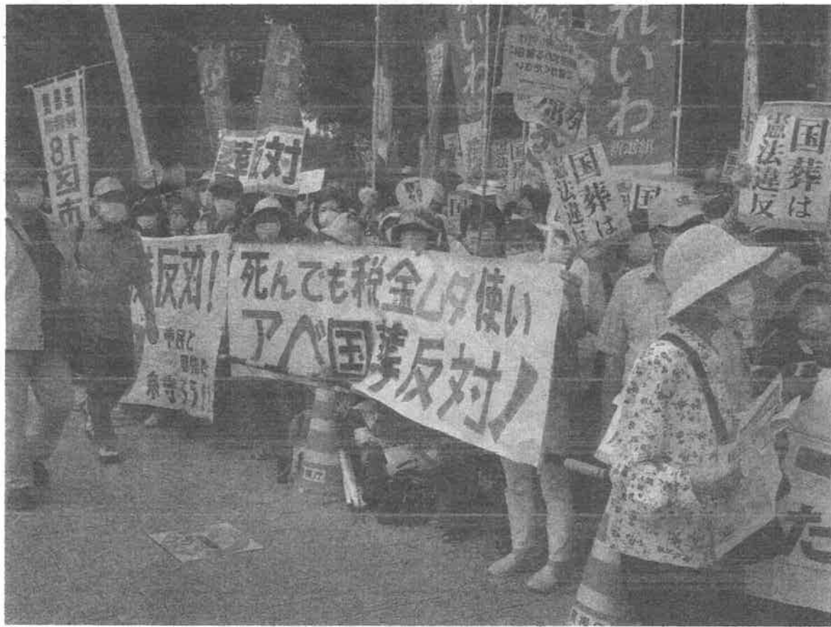
9.27安倍元首相の国葬反対 国会正門前大集会 1万5千人参加 (主催者発表)