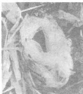
リング状となったシモバシラの花

昨年暮れ、まぼろしの花が観られると言うので、高尾山へ急遽出掛けた。高尾山（599m）山頂から小仏峠に向かう途中のみじ台側巻道、一丁平付近を気をつけながら歩き、目的の花を見つけました。