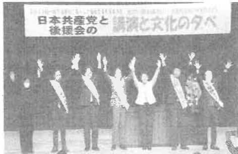
党と後援会による集い。ばば県議・市議4人の予定候補者が発表されました。

市民アンケート結果 953通の回答でした。ご協力ありがとうございました。集計の一部です。 国保税 引き下げ82%、現状のまま16%、その他2% 子ども医療費無料化 18歳まで拡充 72%、今のままで良い28%