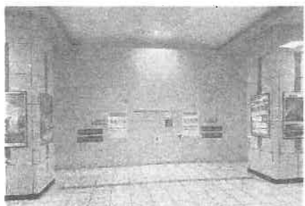
リニューアル工事中 越谷駅

私は「越谷駅のトイレが和式で使えない」そんな声をたくさんいただきました。2021年、東武鉄道(株)にトイレ改修の要望を伝えましたが、「計画的に改修していく」と回答。時期については明らかではありませんでした。