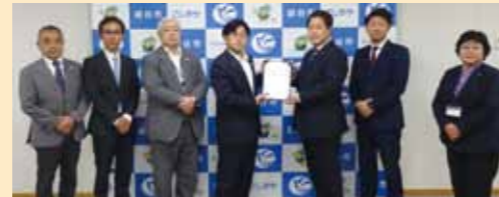
3学園構想について市長・教育長に申し入れ