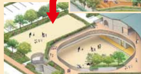
改善後の園庭部分完成予想図