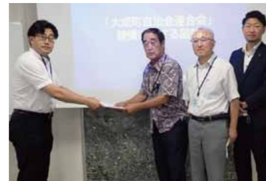
大成町自治会連合会の土木陳情に参加