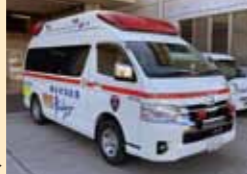
越谷市消防局の救急車▶