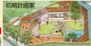
初期計画案 園庭が大幅拡張 (市資料をもとに作成)

中央・大沢第一保育所が緑の森公園保育所に統合されるにあたり、大規模保育所の弊害を軽減するため、園庭の拡張や避難経路の充実などを実現