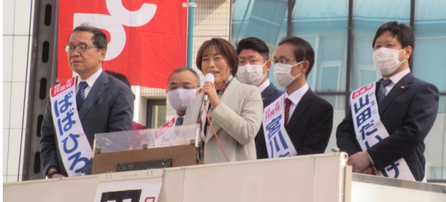
2/12、南越谷・新越谷駅で、 田村智子党副委員長・参議院議員（中央）が訴え （左から、ばばひろし党市県政対策責任者、 大和田さとし、1人とんで工藤しゅうじ、 宮川まさゆき、山田だいすけ各党市議）

2023年2月26日 No.1414 日本共産党越谷市委員会 越谷市花田1-11-15 電話 962-9595 留守の時 988-7001