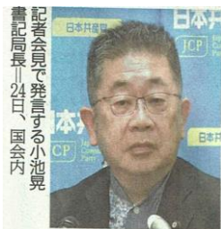
記者会見で発言する小池晃書記局長（24日、国会内）

馬場氏の発言については、「朝日」が25日、「他党、ひいてはそれを支持する有権者をも否定するもの」との識者のコメントを掲載した他、文化放送の大竹まこと氏、TBSラジオの森本哲郎氏、立憲民主党代表の泉健太氏、岡