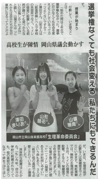
高校生が陳情 岡山県議会動かす

3人は2年生の時の「総合的な探求」の授業で「トイレにナプキンを置くのはどうかな」と話し合い、「生理の貧困」を解決するグループ「生理革命委員会」を結成。「選挙に行けなくても社会を変えよう」と、単に請願するだけでなく、「予算の確保が難しい」と断られるのを防ぐために、クラウドファンディングで212万円も集めつつ、学外の討論会やシンポジウムにも積極的に参加してきました。昨年の同様の陳情に反対した自民党をも動かし、去年以降も共産党の氏平三穂子・県議は感動し、来年以降も設置し続けるための予算確保にがんばると表明。