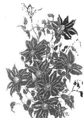
テッセン（鉄線 クレマチス）